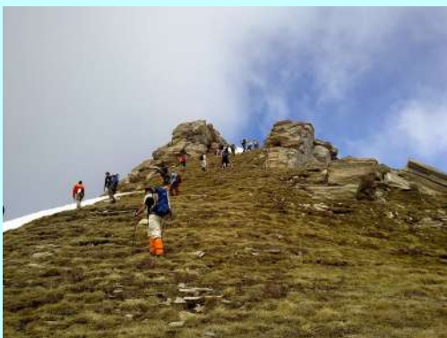
Prolaz ka vrhu

U nastavku, uspon vodi kamenitom padinom, a pred sam izlazak na vrh dočekuju nas velike stene sa obe strane staze, čineći poseban prirodni ulaz na završni plato. Pogled unazad otkriva nam dugačak greben i još stotine sitnih pokretnih tačkica koje nadiru ka istom cilju.