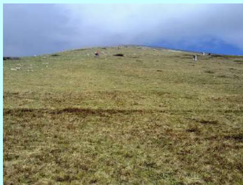
Završni uspon na Kobilicu

Na platou, uz potocić, pravimo malu pauzu da dospemo vode, a zatim nastavljamo dalje, ka obližnjem katunu gde ćemo napraviti veću pauzu.