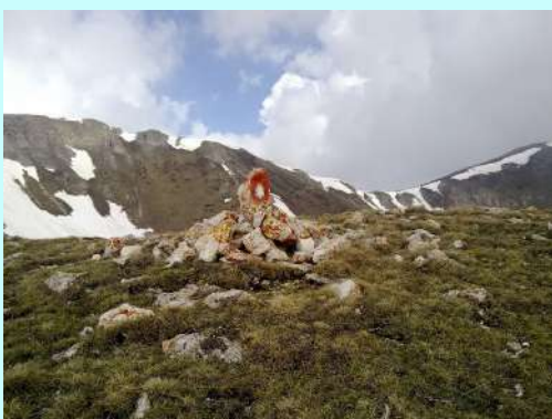
Uspon na Titov

Posle skoro dva i po sata hoda pravimo prvu pauzu, ali se ne zadržavamo dugo. Vreme nam ide na ruku i treba ga iskoristiti. Uspon nije jak, uglavnom se ide izohipsom, blago dobijajući na visini. Tek nakon nešto više od 3 sata hoda mogli smo da vidimo vrh sa poznatom kulom. Od samog vrha deli nas još oko sat hoda.