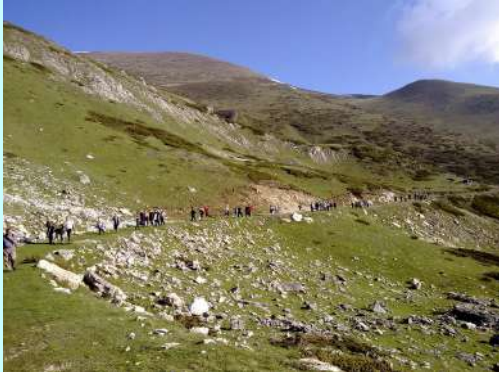
Polazak na Titov