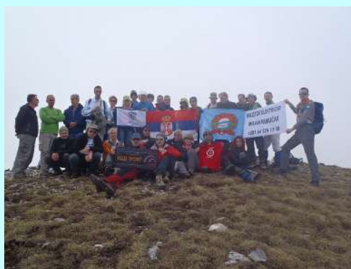
Na vrhu Kobilice 2528 mnv

U nastavku polako, preko kamenite padine izlazimo na vrh Kobilice (2528 mnv). Pogled je prelep na ostale vrhove Šare. Slikanje grupe i polazak nazad. Nastavljamo silazak do platoa, ovaj put presecajući dolinu pravom linijom i ne vraćajući se u katun. Pauza, nastavak i oko 14.30 – 15.00 smo stigli do prevoza, koji nas je potom prevezao na Popovu Šapku, na severozapadu Makedonije, gde nas je čekao smeštaj u hotelu.