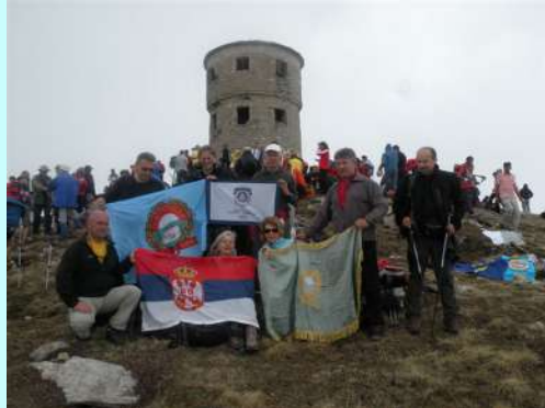
Grupa na Titovom vrhu

Okupljanje naše grupe na vrhu, podizanje zastava, slikanje i kretanje nazad. Spust uvek ide brže i oko 14.30 smo kod našeg hotela, usput posećujući malu crkvicu. Tura je bila uspešna. Zadovoljni i umorni krećemo sa Popove Šapke nešto posle 16.00. Pauzu pravimo ponovo u Predejanama, a u Beograd stižemo oko ponoći sa novim lepim utiscima koje smo jedva čekali da podelimo sa onima koji nisu bili sa nama.