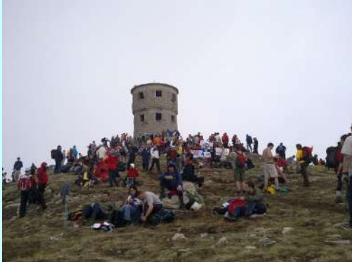
Titov vrh 2747 mnv