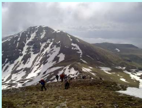
Osvrt na greben

A napred, oko kule, sjatilo se već stotinu planinara i skoro isto toliko zastava. Na vrh izlazimo oko 11.00. Na našu radost, oblaci nam dozvoljavaju predivan pogled na okolne vrhove – Mali Turčin (2702 mnv) i Bakardan (2700 mnv).