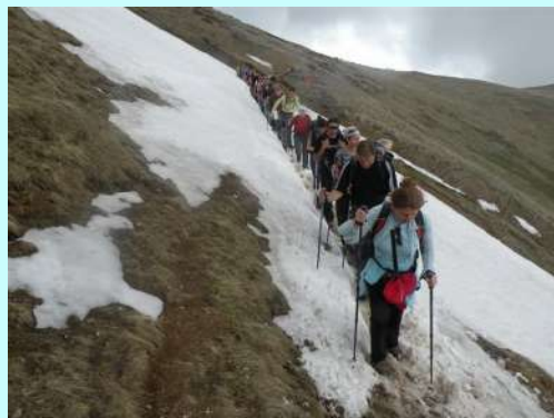
Kolona ka Titovom vrhu

Vreme je dobro za penjanje, ponekad se malo spuste oblaci, odigraju pokoji valcer na vrhovima, a zatim se podignu da nam pruže predivan pogled na lepoticu Šaru.