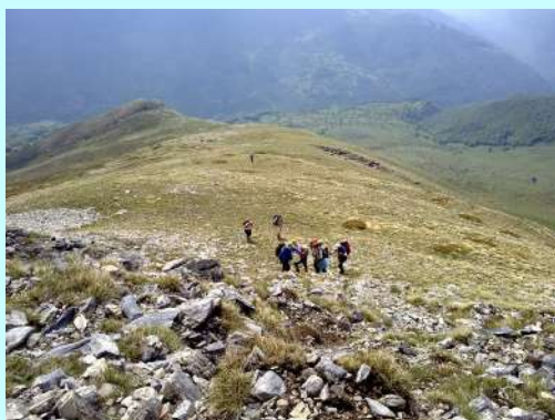
Jos malo do vrha Kobilice

Na platou, uz potocić, pravimo malu pauzu da dospemo vode, a zatim nastavljamo dalje, ka obližnjem katunu gde ćemo napraviti veću pauzu.