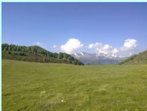
U daljini se nazire Titov vrh

Subota, 28.05.2011. - U selo Brodec (1200 mnv), polaznu tačku za uspon na Kobilicu, stigli smo oko 05.00. i već u 05.45 svi smo manje-više bili spremni za polazak. Staza u početku vodi kroz selo u koje smo pristigli, a koje se nalazi odmah iznad Tetova, a zatim kroz šumu izlazi na prelepi plato odakle nas sa desne strane sačekuje divan greben Kobilice, a sa leve u daljini nam se osmehuju i ostali vrhovi Šare. Sasvim u daljini nazire se i Titov vrh. Uspón je krenuo od samog početka staze. Sa nama je i lokalni vodič, koji nas strpljivo vodi preko predivnih livada punih ljubičica i ostalog cveća.