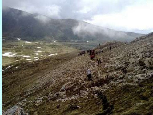
Vreme nas služi

Vreme je dobro za penjanje, ponekad se malo spuste oblaci, odigraju pokoji valcer na vrhovima, a zatim se podignu da nam pruže predivan pogled na lepoticu Šaru.